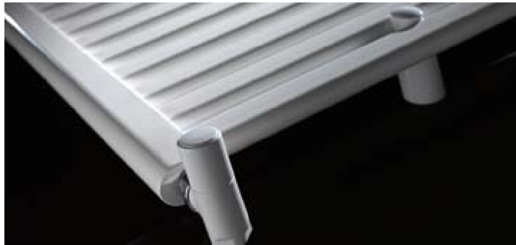
44 Connessioni verticale / Vertical joint: 130-330

Equazione caratteristica: K_m \Delta t^n . Valori di potenza termica stimati presso il Politecnico di Milano secondo la norma EN 442. Pressione massima di esercizio di 6 bar, temperatura massima d'esercizio 120°C. Mozzo Ø: 1/2". Characteristic Equation: K_m \Delta t^n . Thermal power values estimated at Milan Polytechnic in accordance with the EN 442 norm. Working pressure does not exceed 6 bar, maximum working temperature: 120°C. Hub Ø: 1/2".